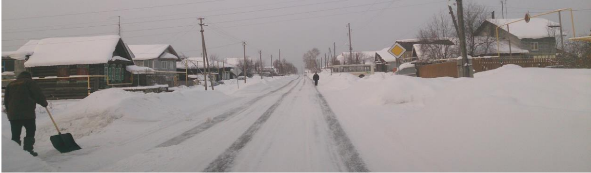
Winterse weg buiten PerwoUralsk (jan.15)