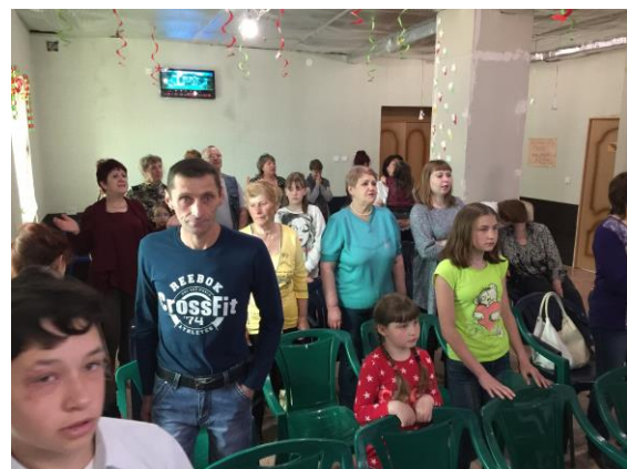
In kerk te Karpinsk