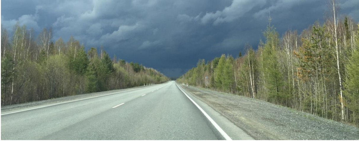
Opweg naar KrasnoTurinsk