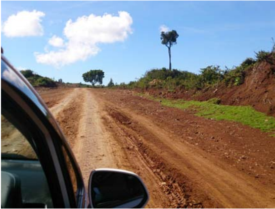
"Weg" naar Shamara...

de wonderbaarlijke naam "Nyahururu" gingen we zondagmorgen verder over "wegen" zónder asfalt... Anderhalf uur later kwamen we aan bij de christenen in een kerk in Shamara in de bergen (zo'n 210 km van Nairobi).