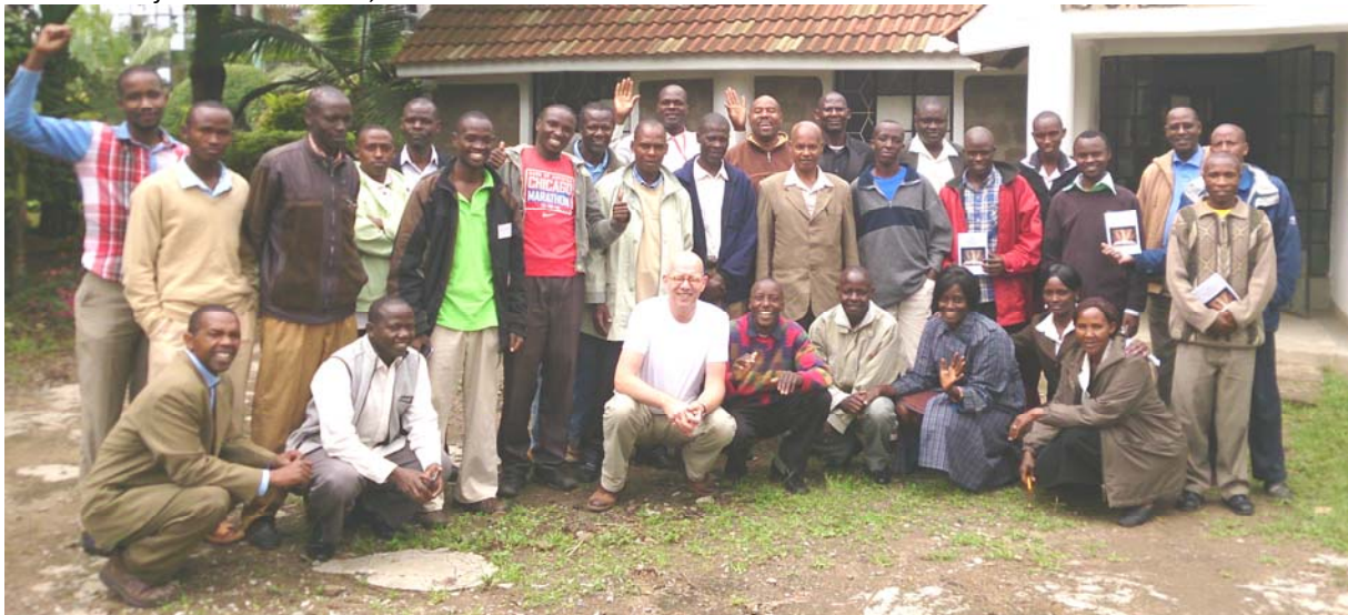
Studenten Bijbelschool Nairobi, november 2014