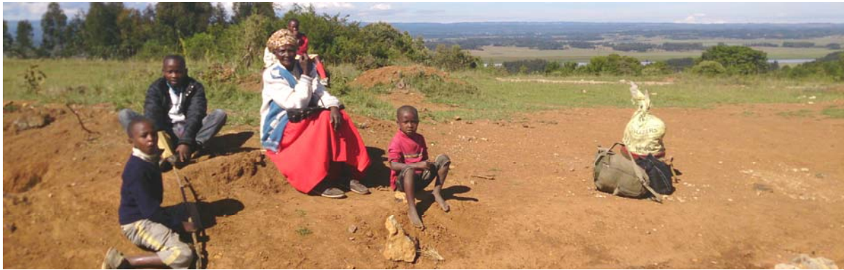
Wachten op de bus naar Nyahururu