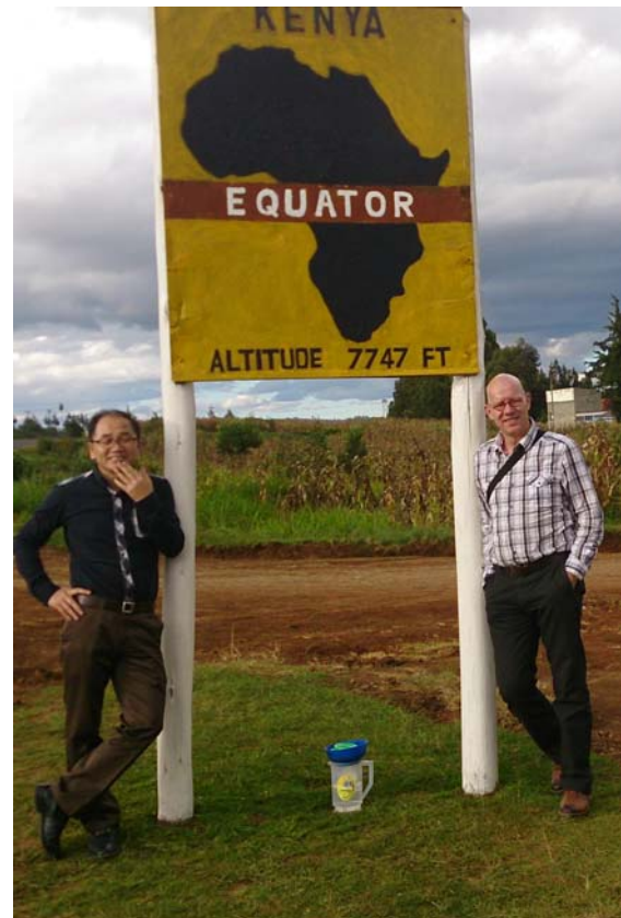
Op de evenaar op weg naar Nyahururu

lesgegeven (welke ik simultaan mocht vertalen vanuit het Russisch naar het Engels) over de Doctrine van de Bijbel als Gods Woord. In die week heb ik in de