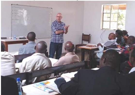
Les geven op de Bijbelschool in Nairobi