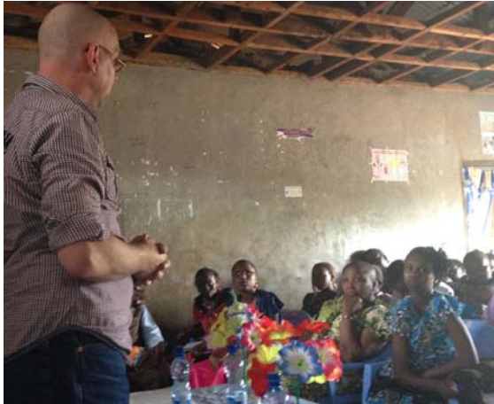
Preken in Kimani (Mount Kilamijaro)

wegens de omvang van deze onderwerpen, kwam ik tijd te kort om alles te doen wat voorbereid was. (Maar goed, toch beter zo, dan dat je na één week jezelf gaat afvragen wat je verder nog kan vertellen.)