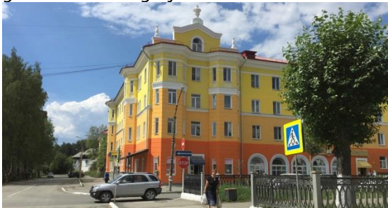
Eindelijk: huizen worden opgeknapt in PerwoUralsk...!

Als mijn visum eind van dit jaar afloopt en ik dan dus een nieuwe nodig heb, heeft dat wel wat meer impact. Zoals we nu begrijpen zal de gemeente in PerwoUralsk een werkverklaring voor me moeten aanvragen. Dat kost tijd en met name geld. Ik kom dan voor een zendingsreis in dienst van de kerk. Wat houdt dat in? Wat gaat dat de gemeente kosten? Moeten zij verzekeringen afsluiten voor elke gastspreker die komt en belasting afdragen? Welke gevolgen heeft dat voor ons? Moet je bijvoorbeeld veel langer van tevoren een visum regelen? Kan je voor een jaar een zogenaamde multiple entry visum krijgen, zoals ik nu heb, zodat je meerdere keren per jaar Rusland in en uit kan op hetzelfde visum, of zal dat per exacte data gaan en eenmalig zijn?