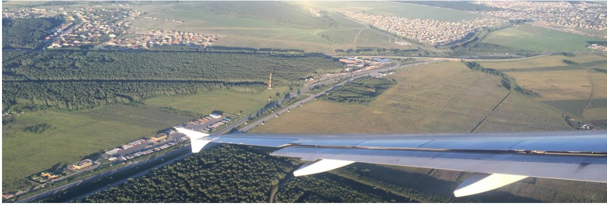
Aanvliegen richting Jekaterinnenburg